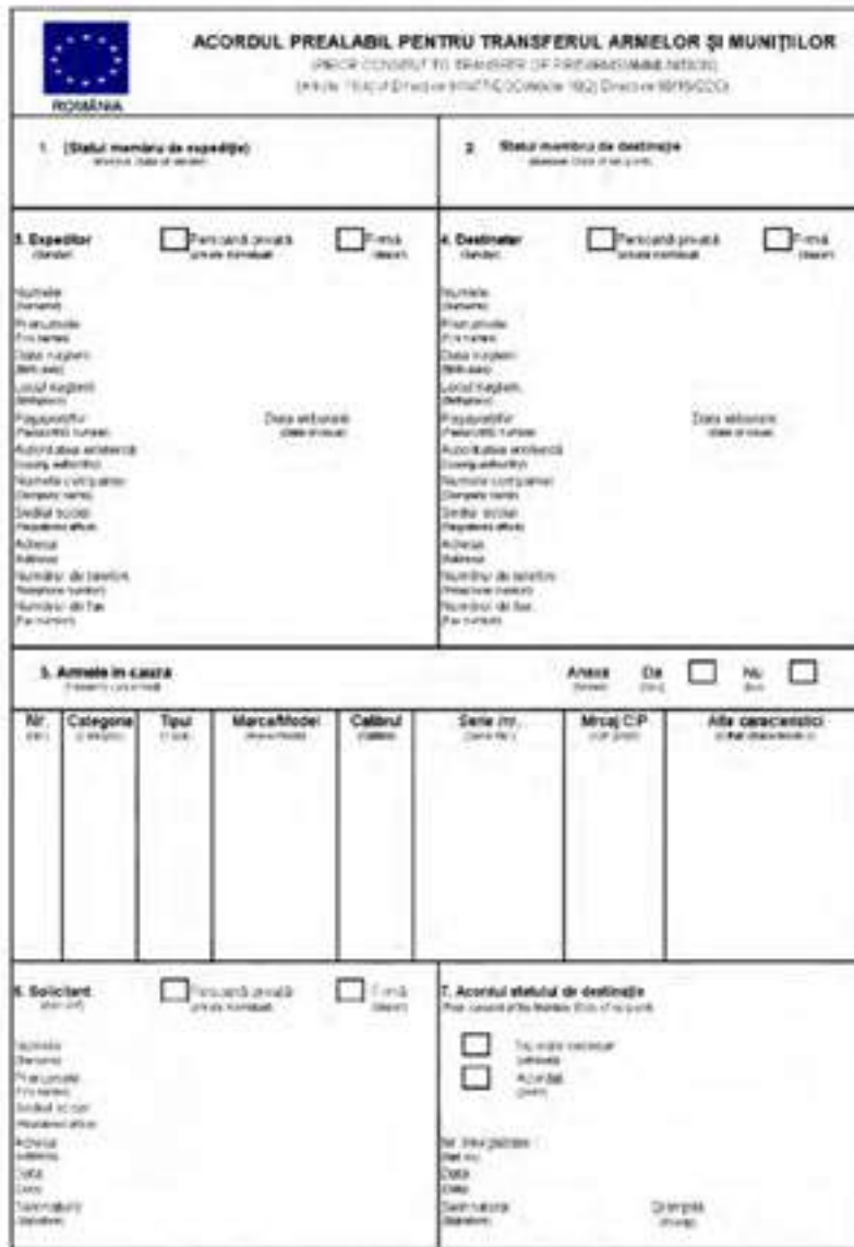
ANEXA nr. 44: (MODEL)