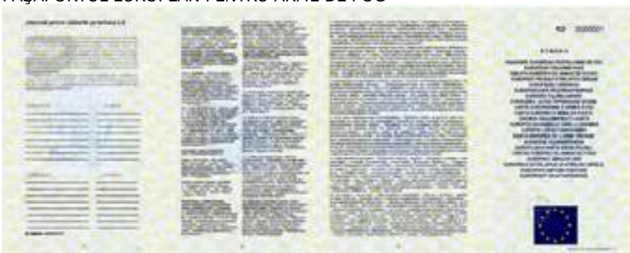
ANEXA nr. 15: (MODEL) PAȘAPORTUL EUROPEAN PENTRU ARME DE FOC